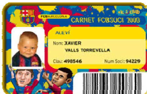
La Baby Card del Barcelona Futbol Club